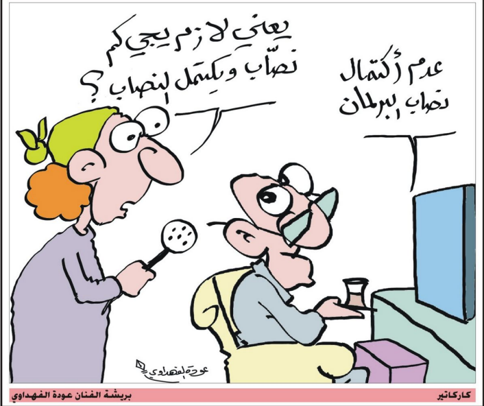
بريشة الفنان عودة الفهداوي