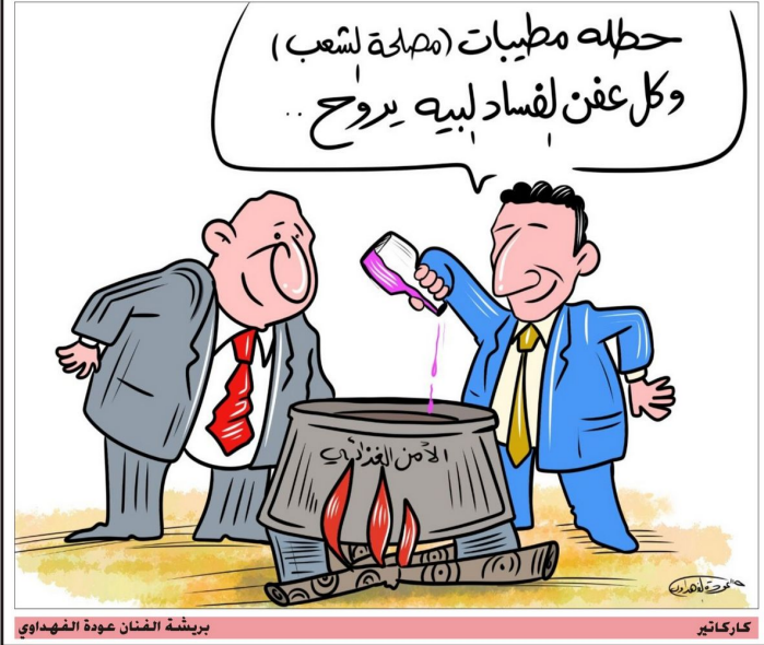
بريشة الفنان عودة الفهداوي كاركاتير