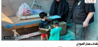
بغداد المستور قامت مؤسسة اليتيم الخيرية في كرازة والكرازة بالتعاون مع المتبرعين عن الكرام بتجهيز إحدى عوائل الأيتام المسجلة داخل مكنة في الخياطة...