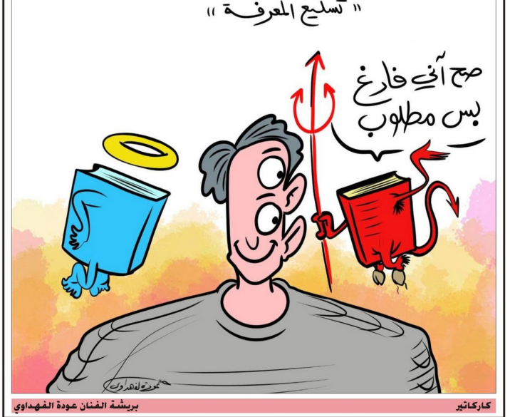
بريشة الفنان عودة الفهداوي كاركاتير