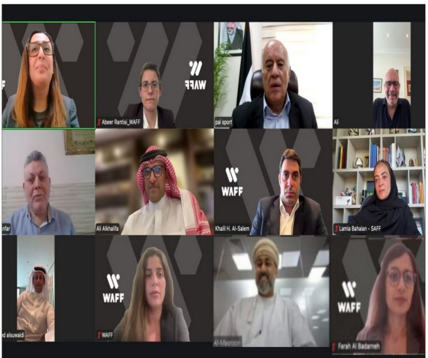
حضور الاجتماعات الإقليمية...