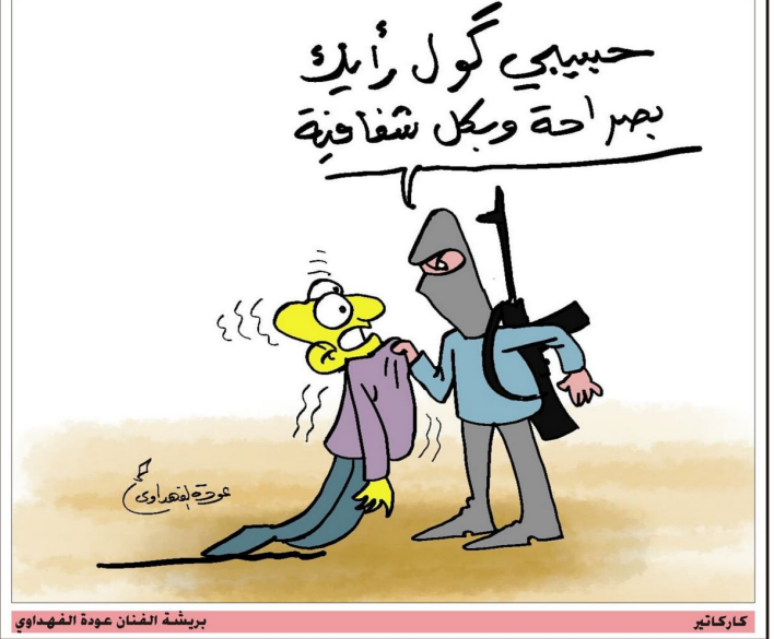
كاراكير بريشة الفنان عوده الفهداوي